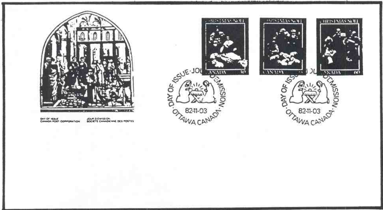
St. Francis of Assisi and the Christmas Crib. Gozzoli. Church of San Francesco, Montefalco, Italy.